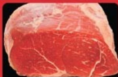
FETTINE COSCIA DI BOVINO