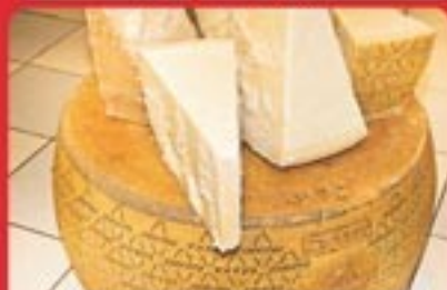
GRANA PADANO 24 MESI IN TRANCIO