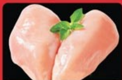
PETTO DI POLLO INTERO