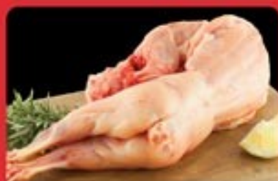
CONIGLI BERTI FORLIMPOPOLI