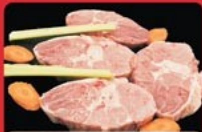
OSSOBUCO DI VITELLO

€ 11,90 AL KG € 10,90 OLTRE 1 KG € 9,90 OLTRE 2 KG