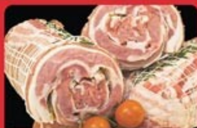
ARROSTO DI VITELLO