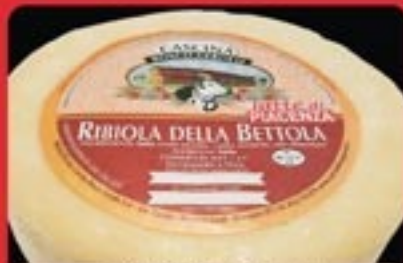
CACIOTTA RIBIOLA MEZZA O INTERA