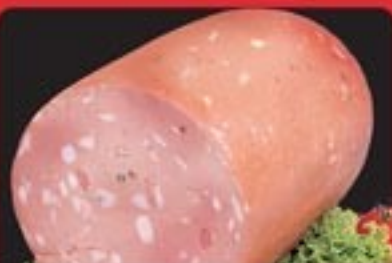
MORTADELLA NEGRONI CON E SENZA PISTACCHI