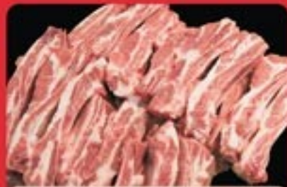
PUNTINE DI SUINO