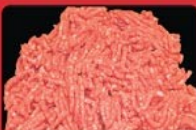
MACINATO SCELTO DI BOVINO