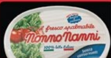
SPALMABILE NONNO NANNI