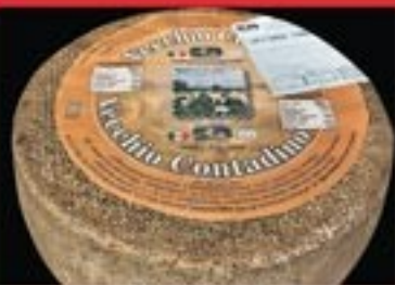
PECORINO VECCHIO CONTADINO