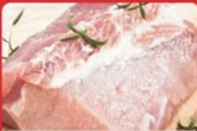
LONZA DI SUINO A FETTE

€ 11,90 AL KG € 10,90 OLTRE 1 KG € 9,90 OLTRE 2 KG